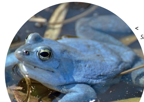
< Skokan ostronosý

Přírodní památka Plačkův les a říčka Šatava se nachází v nivě řeky Jihlavy a najdeme zde poslední pozůstatky lužního lesa se vzácnou faunou a florou.