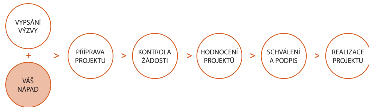
schéma postupu při předkládání projektové žádosti

Celý proces přidělování finančních prostředků je přesně předem nastaven, podléhá kontrolám a každá MAS, aby mohla být podpořena, musí splňovat standardy kvality, které jsou pečlivě kontrolovány a sledovány.